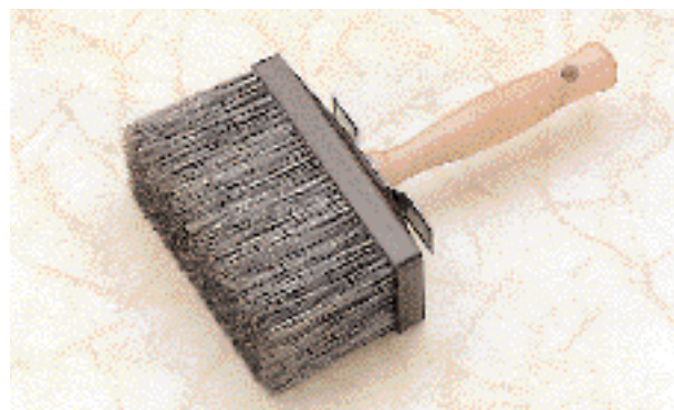
Brosses en soie de Chine grise, réf 664